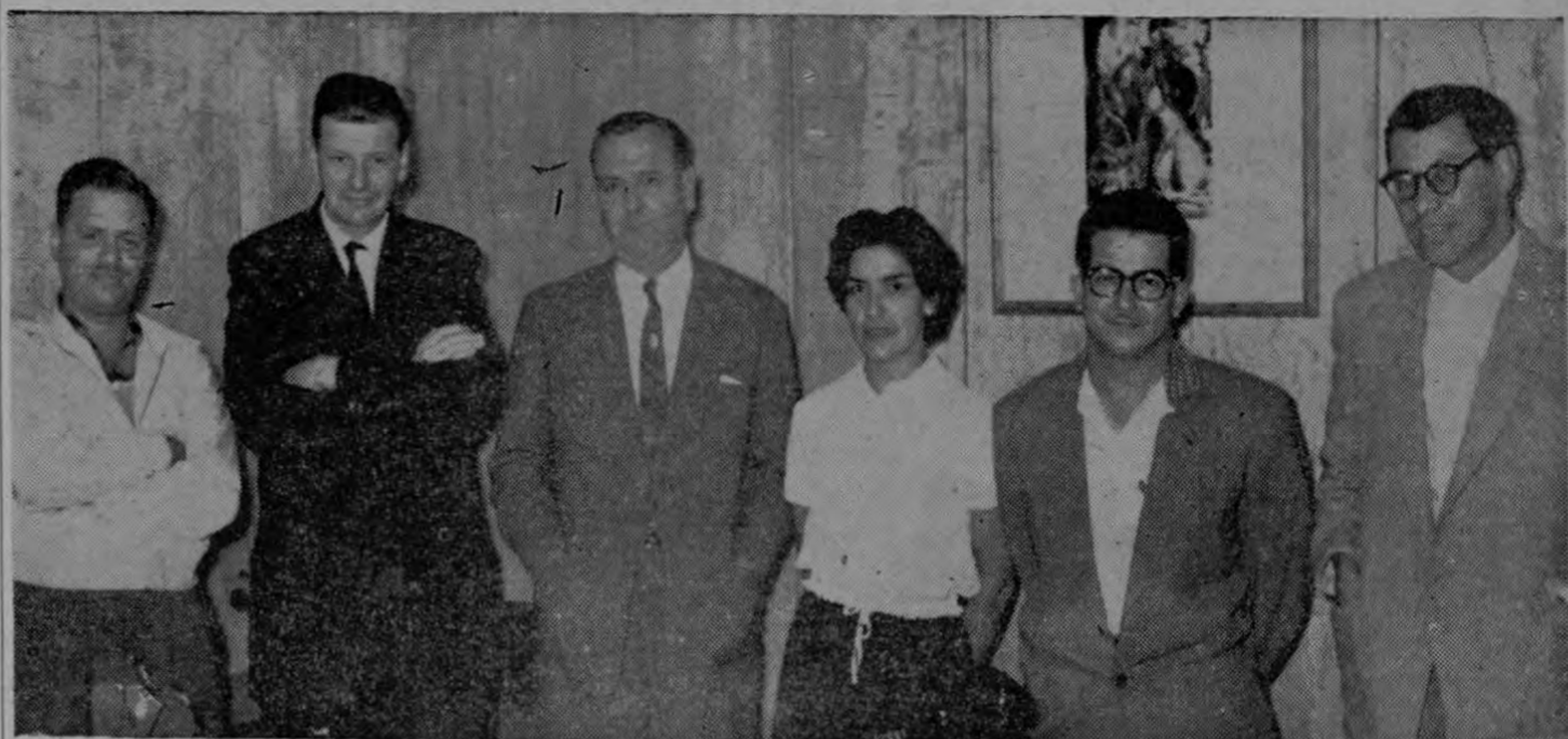
LA NUEVA DIRECTIVA DE LA FEDERACION DE BEISBOL. Ayer celebró su primera reunión la nueva Junta Directiva de la Federación Nacional de Beisbol. LA PRENSA LIBRE, no podía pasar por alto este acto de suma importancia...

Estamos en la mejor disposición de llegar a un arreglo de caballeros con los directivos limonenses. El 7 de junio dará comienzo el Campeonato josefino. El beisbol no debe quedar estancado y debe dársele el mayor impulso.